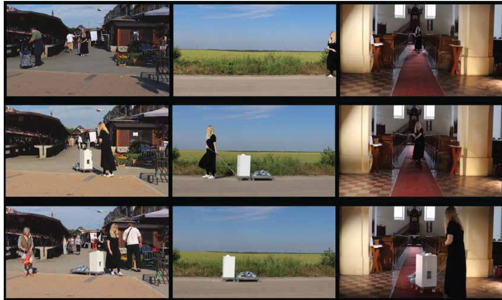
Fluidni prostori – dokument X | video dokument performans, 5.03 min. | 2021.