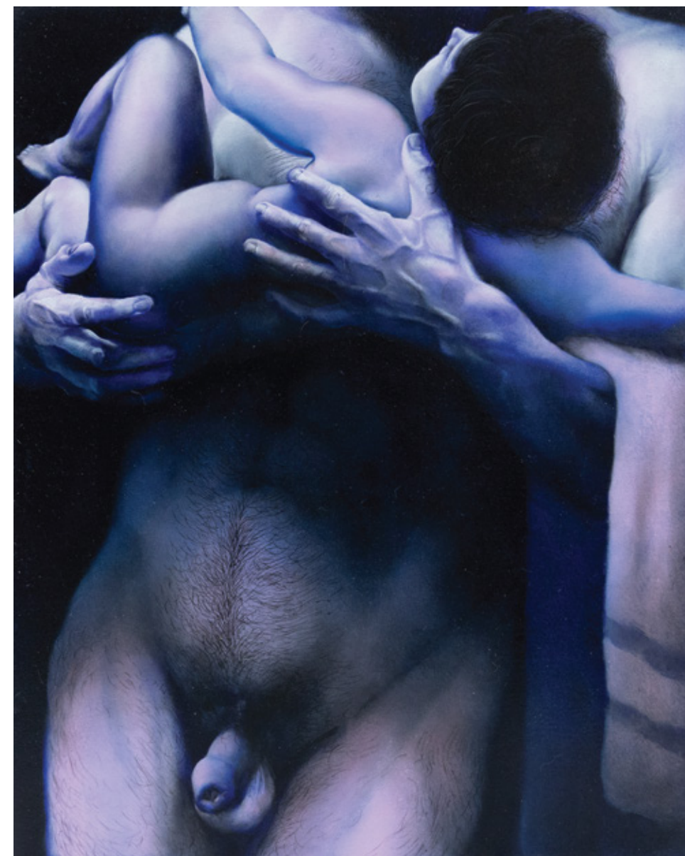
Bez naziva (musko telo s detetom) / 50 x 40 cm / Ulje na MDF dasci / 2024.