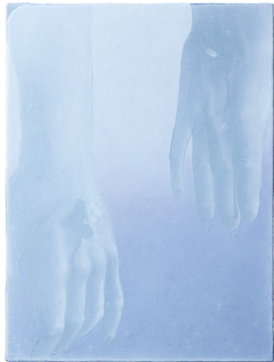
Da li povređuješ, da li pomažeš? 20 x 15 cm / Ulje na MDF dasci, lak / 2022.