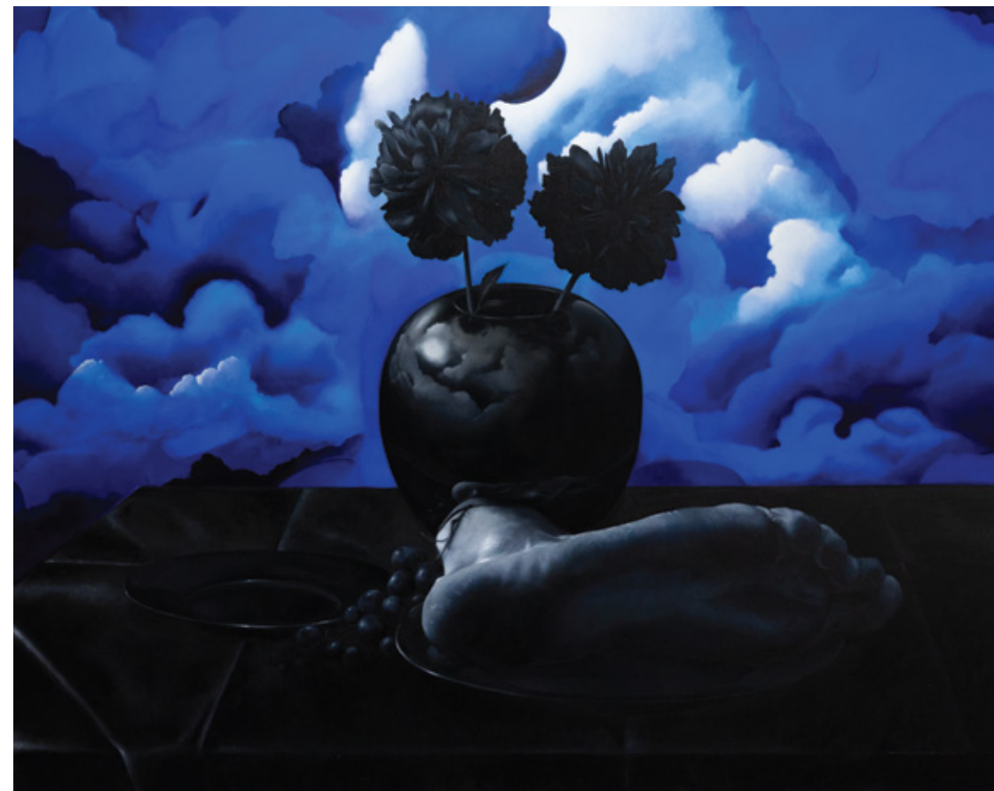
EUROPA / 190 x 240 cm / Ulje na lanu / 2024.