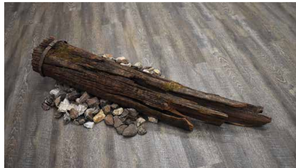
Nova zgarista , instalacija, promenljive dimenzije, 2023.