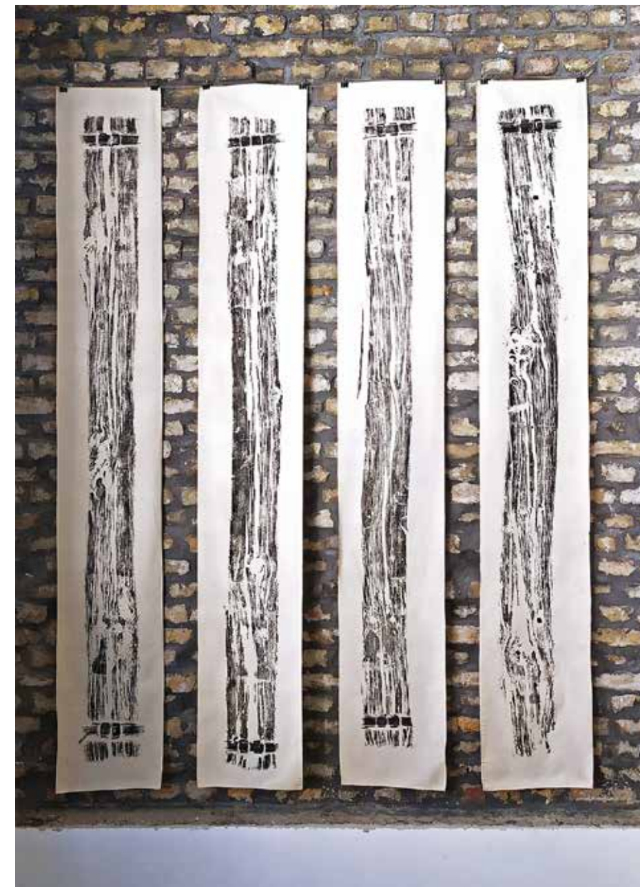
Pragovi I , poliptih, visoka štampa na platnu, 240 x 150cm, 2023.