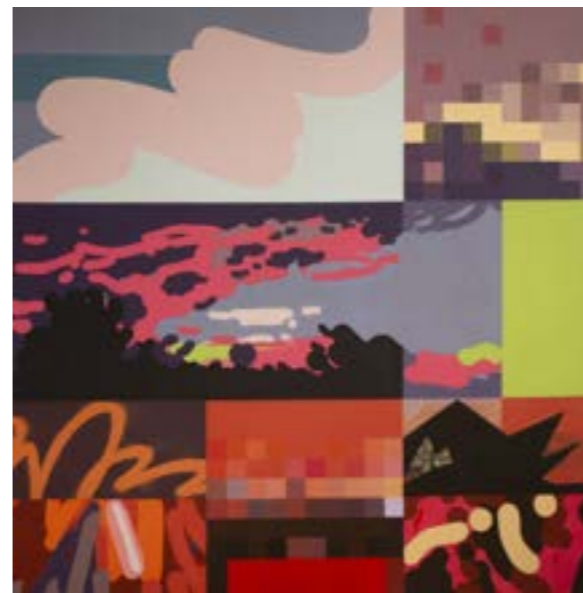
Sećanje na zalazak