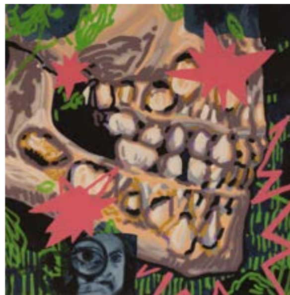
Loše po tebe