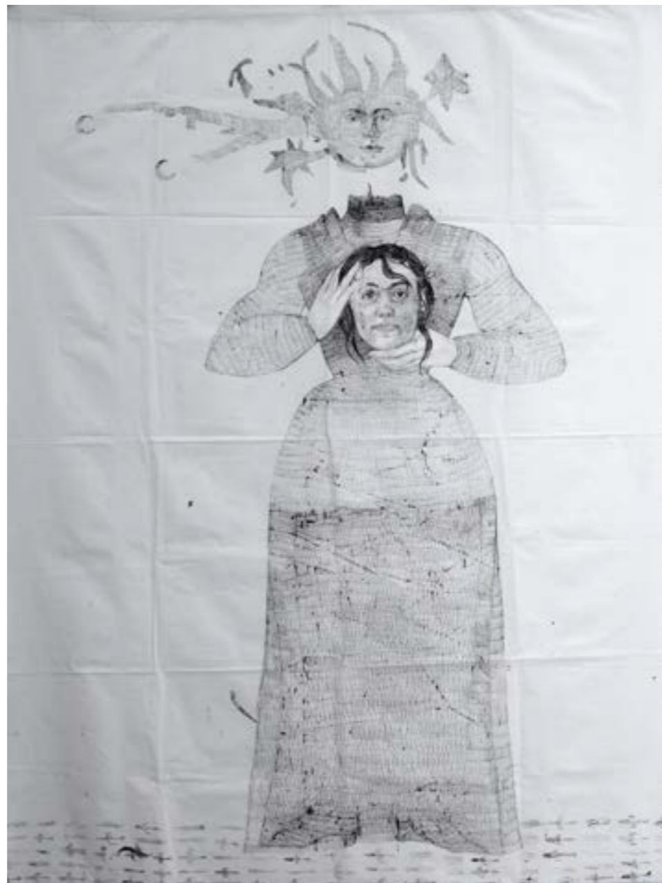
„ Sunce “, tuš i pero na platnu, 160x210cm