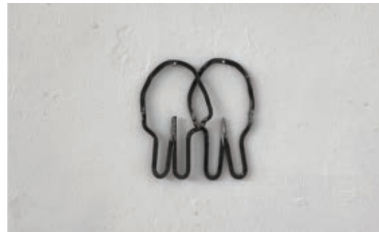
„ Bez naziva “, firiket, 30x25cm