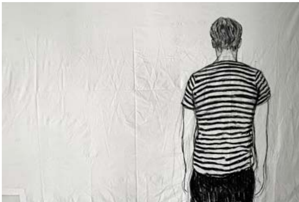
Detalj rada „ Čekam “, iz ciklusa „Aleksa ima brata, ali to nisam ja“, ugljen na čaršavu, 150x220cm