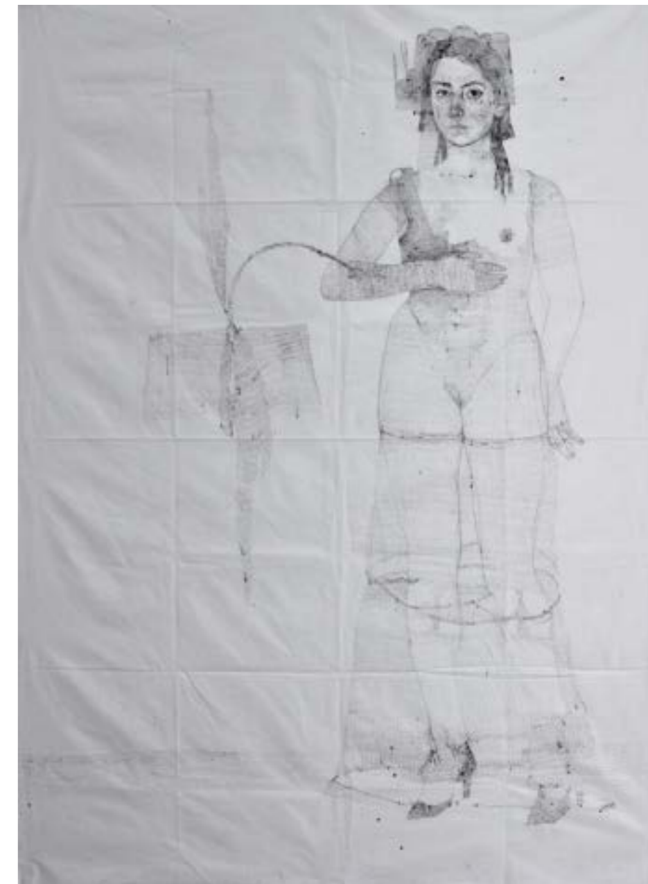
„ Ranjena “, tuš i pero na platnu, 160x 230cm